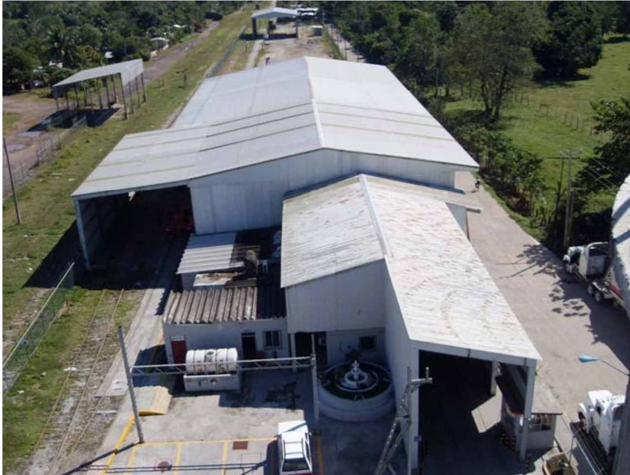
Terminal Ferroviaria de usos múltiples en Roberto Ayala, Tabasco