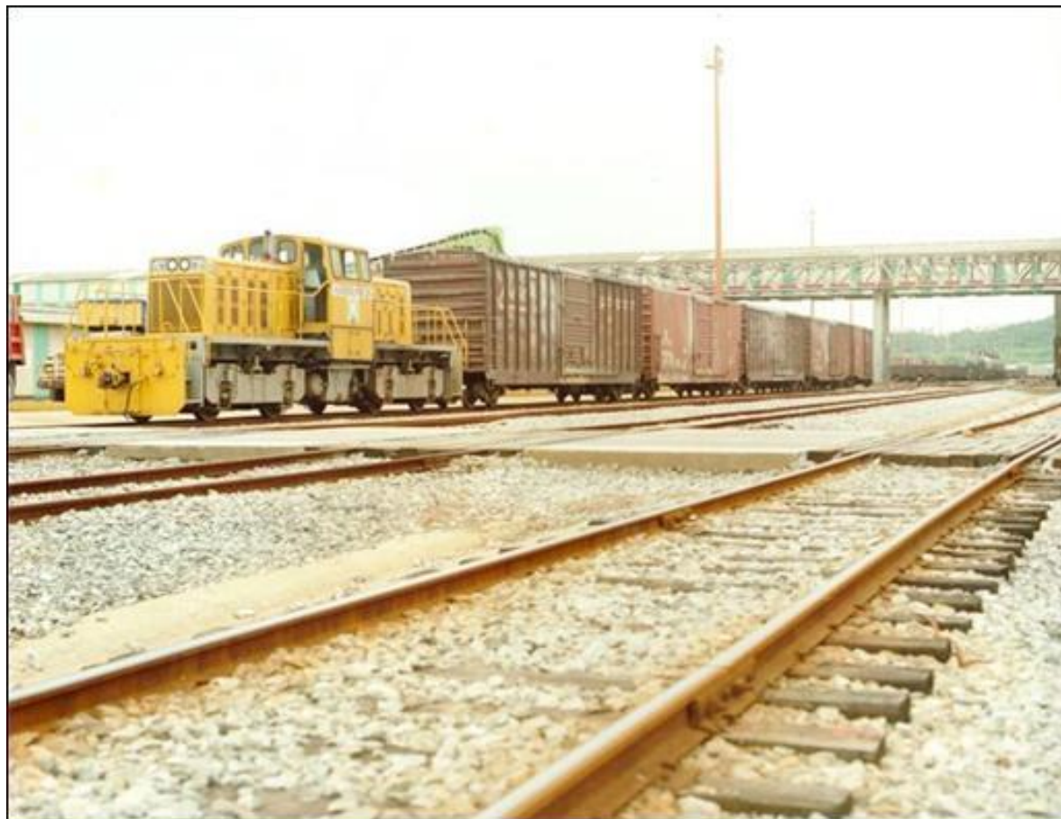
Terminal Ferroviaria en Coatzacoalcos, Veracruz